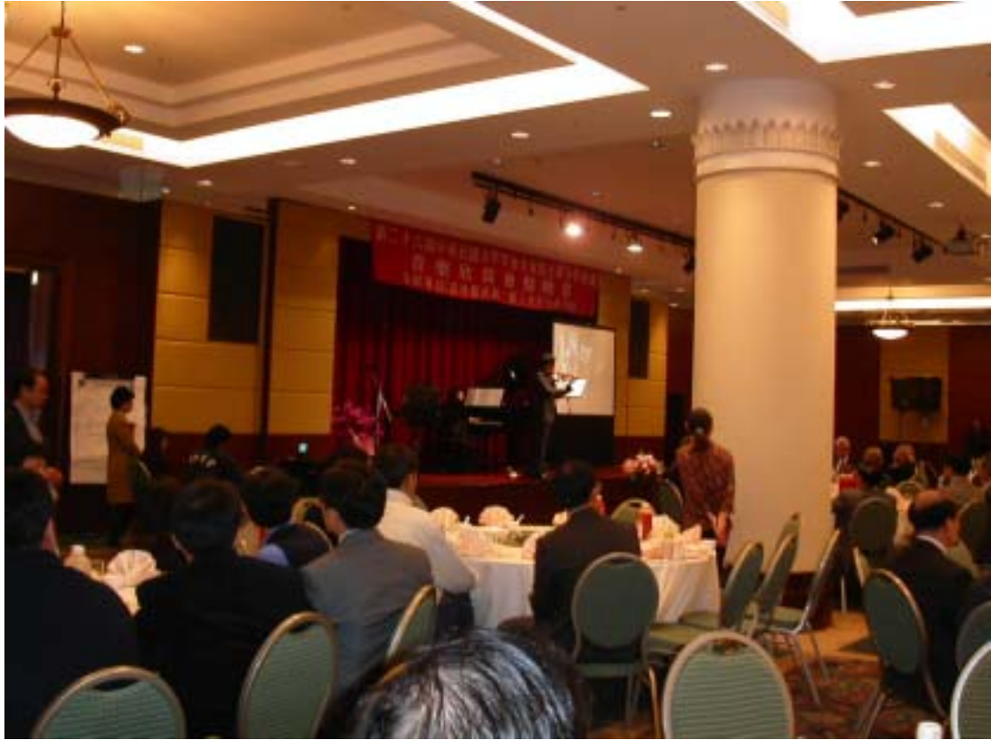
《圖二 力學年會晚宴》