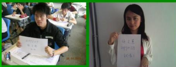
初賽未攜帶證件者處理方式: 先拍照-入決賽者再次核對