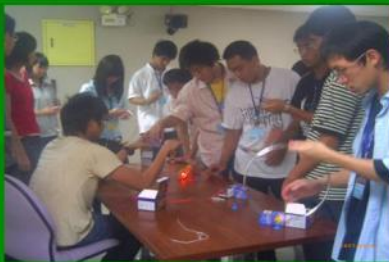
休息時間科學餘興