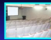
大禮堂會議室(四間)